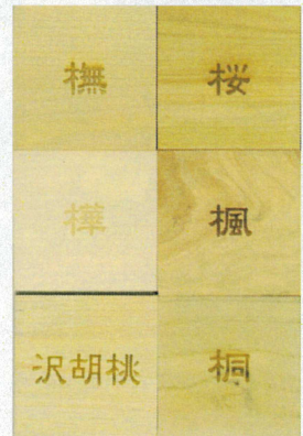
写真4. 秋田県産広葉樹材の一例

地域の木材利用の特色を強めるために、全国どこにでもあるスギではなく、地域風土で特色の出やすい広葉樹を素材とした製品開発が優位であると考え、木高研では、雄勝広域森林組合と雄平原木市場の協力の下で、24樹種の広葉樹材を調達し、利用可能性について検討を進めている。写真4に代表例を示す。