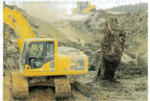
写真3. 埋没木出土の状況

以上のように、樹種には固有の細胞や並び方があるため、葉や樹皮がなくとも、組織構造からある程度の樹種(属レベル)の絞り込みは可能で、文化財や出土物(埋没木)の樹種同定に活用されている。木高研でも、秋田県にかほ市象潟町の日本海沿岸自動車道象潟ICの建設工事の過程で大量に発見された埋没木(写真3)の樹種同定に取り組んでいる。