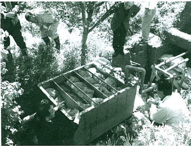
水質浄化濾材試験の様子 (二ツ井町内)