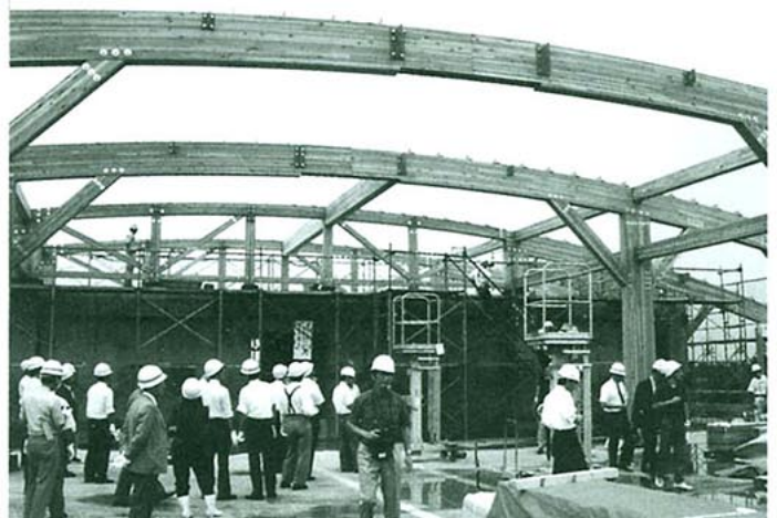
建設工事の中の本館棟(1995年)

今後の具体的な研究展開についても、所内で議論が進められているところであるので、ここでの披露は避けたいと思う。ただ、2003年度から木材加工推進機構を中核機関として開始された「都市エリア事業」の成果が順次明らかになってきており、国土保全・地球温暖化防止に寄与するためには、地域の森林・林業の活性化、森林資源の循環的利用が重要であることを再認識した。ここで得られた成果を森林資源の理想的な循環系の創出を意識した研究開発に結びつけ、技術発信型の親環境産業の構築を会員諸兄とともに進めたい、と研究所では考えているところである。