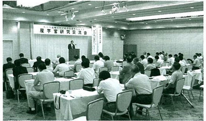
産学官研究交流会 8/9 (平安閣能代)